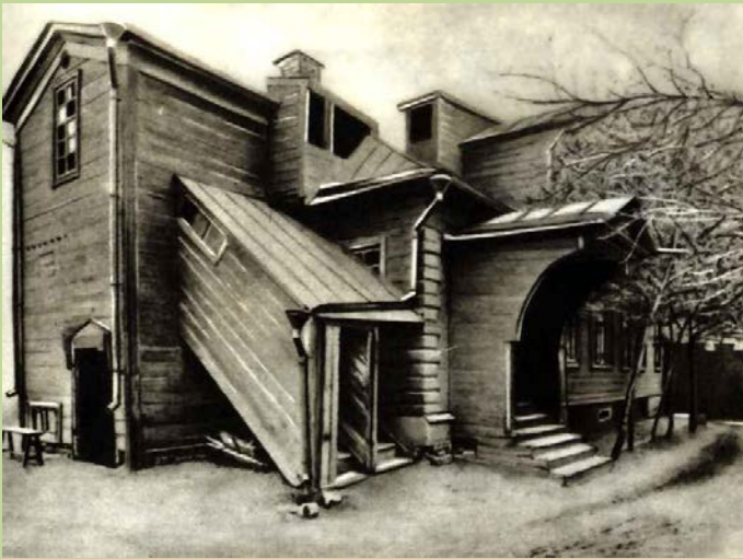
Парадное крыльцо дома Григорьевых, в котором жил Фет в период учебы в университете

В конце 1839 или начале 1840 года Фет послал несколько стихотворений в журнал «Отечественные записки», затем в «Сын Отечества» и «Библиотеку для чтения», но получил отказ. В результате вышел сборник стихов Фета «Лирический пантеон», изданный за свой счёт.