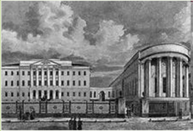
С 1838 по 1944 год Фет обучался на словесном отделении Московского университета