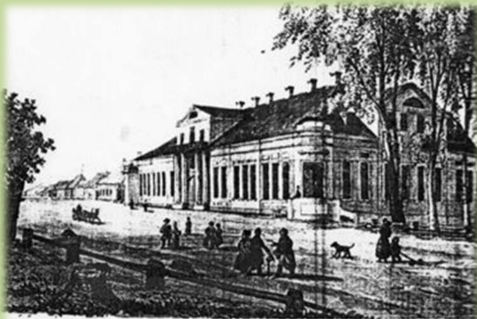
Частный пансион Крюммера