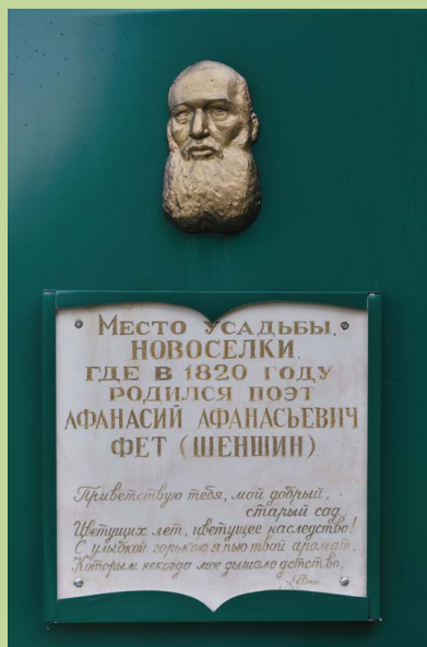
Мемориальная табличка в родовом поместье Шеншиных